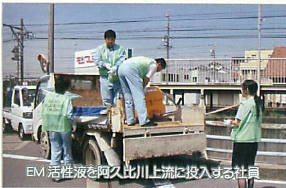
EM 活性液を阿久比川上流に投入する社員

阿久比川及び各支流(殿越川・前田川・草木川・福住川など)の土木工事を行っています。EM 活性液を毎週 100 リットル投入し、水質向上に役立っています。この活動によって、河川や池がキレイになると評価をいただいています。