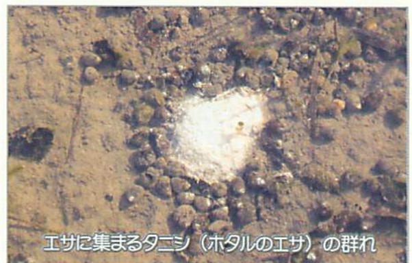
エサに集まるタニシ (ホタルのエサ) の群れ

毎年 6 月に平家ホタルを捕獲し、自宅で一年間卵から養殖しています。シーズンには 2~3 万匹のホタルが乱舞し、地上の天の川に。それを見た子どもが喜ぶ顔と歓声は、ビールをとともおいしくしてくれます。学校などにホタルの幼虫を提供しています。