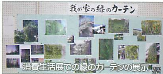
消費生活展での緑のカーテンの展示