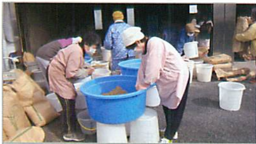
EM 活性液と米ぬかを混ぜて生ごみ処理用のアスパづくり