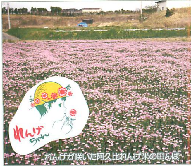
れんげが咲いた阿久比れんげ米の田んぼ