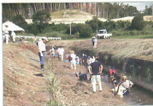
草木川で子ども達と、毎年恒例の魚釣り

子ども達の喜ぶ笑顔が活動の活力になっています！今後はもっともっと喜んでもらえるように、草木川にアユを遡上させるまでがんばります！