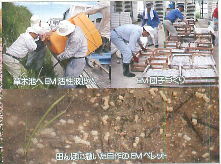
草木池へEM 活性液投入