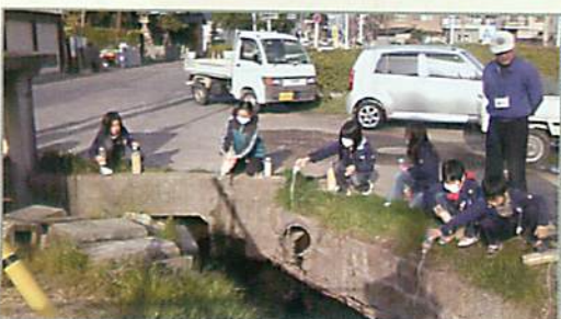
自分たちで作った米のとぎ汁 EM 発酵液を近くの小川に投入