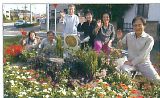
会員の皆さんと花壇の前で

東海市が花と緑いっぱいの街となる様に行動すると共に、多くの市民が家庭や地域で花作り、花壇作りを行う場合のサポートを行います。花好きの人たちどうし親睦が図れるよう、情報発信を行います。