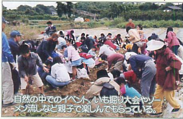
自然の中でのイベント、いも掘り大会やソング流しなど親子で楽しんでもらっている。

加南ふれあいの会は「加南ふれあいの森」約 2,000 坪を管理するためにできたボランティアグループです。活動は毎週火・金曜日 9 時から 2 時間程作業をしています。「加南ふれあいの森」は子ども達が自然にふれあう場所として、又世代を超えて交流できる場として 10 年前にできました。高齢者の活躍の場にもなり、皆さん喜んでいきます。