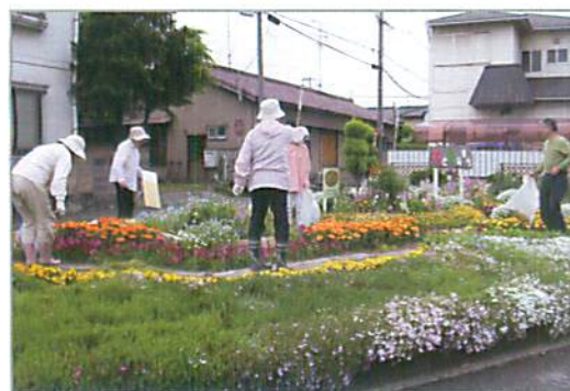
高横須賀町西岨の花壇の手入れ