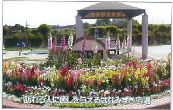
訪れる人に癒しを与えるはなみずき広場

「加南花咲かせ隊」は平成 18 年度から東海市加木屋南コミュニティのボランティアグループの一つとして活動を始めました。加木屋南公園はなみずき広場の花壇とラベンダー畑を担当。また毎年、春と秋の花壇コンクールに応募し、優秀賞や優良賞等を獲得しています。広場に遊びに来る人たちに安らぎや癒しを感じてもらおうよう頑張っています。